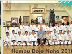
Hombu Dojo Naha 2010