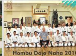
Hombu Dojo Naha 2010