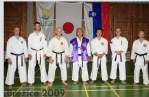
Slovenija Gasshuku - Brežice 2009