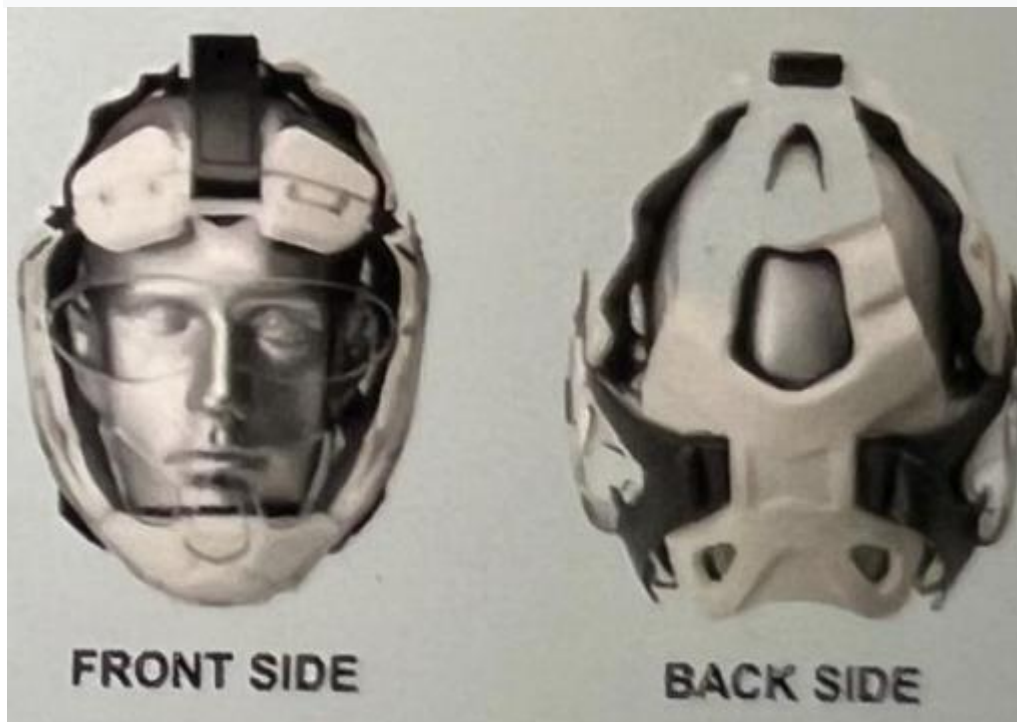
primer čelade WKF za kategorije U14

Za kategorijo U14 sta obvezna tako telovnik kot maska, od leta 2024 dalje pa bo obvezen jopič in čelada, odobrena s strani WKF.