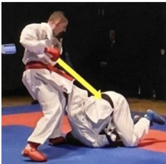
primer tehnike, za katero se podeli ippon

Primeri izenačenega izida, ko o zmagovalcu odloča HANTEI: