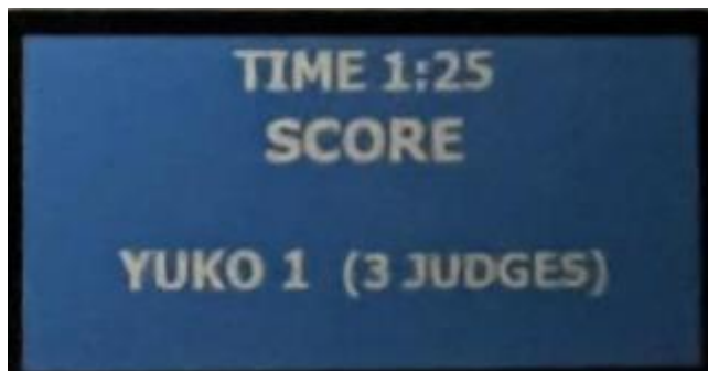
Prikaz točke na semaforju

Glavni sodnik samostojno izreka vsa opozorila in kazni, brez podpore stranskih sodnikov. Točkujejo izključno stranski sodniki, pri tem pa uporabljajo ustrezni tehnični sistem (slika spodaj).